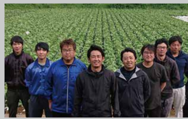
有限会社DIC信濃川上の皆さん