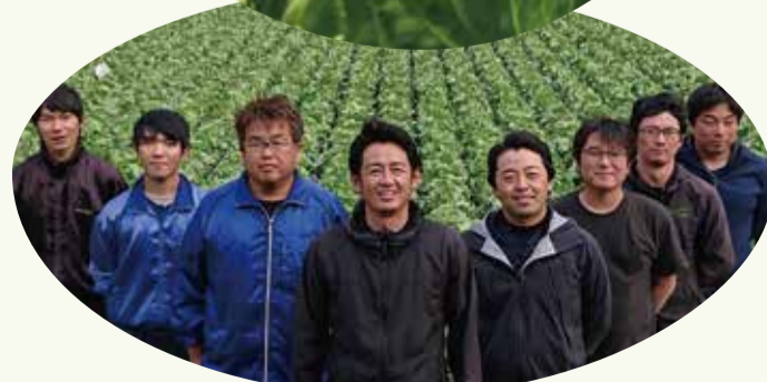
有限会社 DIC 信濃川上の皆さん