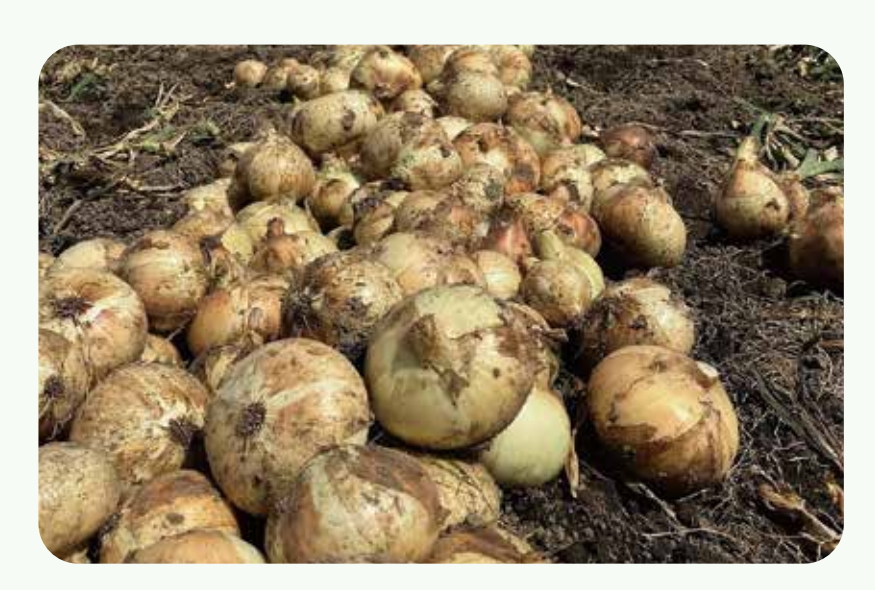
有明海に面した干拓地の塩分濃 度の高い土地で栽培され、ミネ ラルをたっぷり含みます!